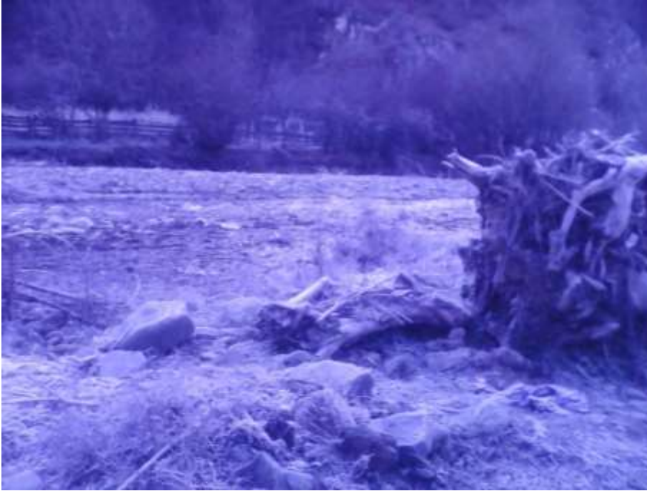
Слика 2. Нанос разног порекла у Козједолској реци

Дивље депоније отпада у коритима бујичних водотока, које садрже све могуће предмете из домаћинства (од ситнијих предмета, преко беле технике, до аутомобила) имају веома негативне хидротехничке и еколошке ефекте.